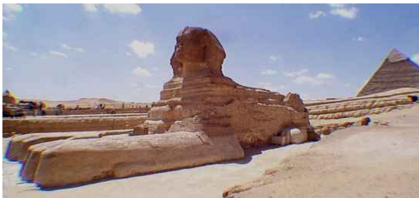
ابوالهول بزرگ در جیزه (۱)

"ابوالهول" تندیس مشهور مصر است که نیز یادگار عهد فراغنه و در جیزه واقع میباشد. این هیکل که در هیئت سر "انسان" و بدن "شیر" از سنگ تراشیده شده و ۱۷ متر ارتفاع و ۳۹ متر طول دارد، در نزد فرنگیان بنام Sphinx یاد میشود. این مجسمه که مصریان "عرب شده" آن را بنام "پدر ترس" (ابوالهول) نامیده اند، در حدود ۲۹۰۰ سال پیش از تولد عیسی مسیح در زمان فرعون "خوفو" ساخته شد، که بانی "هرم بزرگ" مصر بوده است.